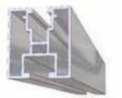
Szerelő profil (rajzos)

rozsdamentes+alumínium anyagok rozsdamentes csavarok+anyák EPDM szigetelőgyűrű kompletten