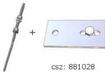
Menetes szár + szerelőlemez